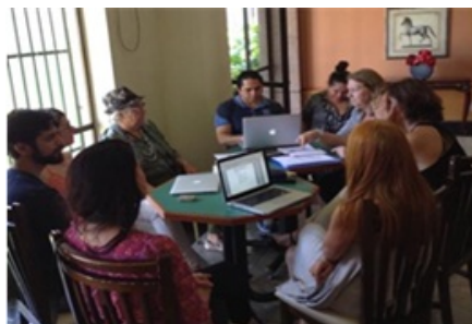
Imagem 1: Reunião preliminar das diretorias da FAEB, ANPAP, ANDA, ABEM, ANPAP e ABRACE, em 18/02/2016.

O primeiro documento produzido em conjunto com as Associações, o ofício 06/2015/FAEB de 30/11, foi protocolado no MEC no dia 11/12, dirigido ao Ministério da Educação, à Secretaria da Educação Básica, à Diretoria de Currículos e Educação Integral, à Comissão Bicameral da BNCC e à equipe de especialistas da Área de Arte da BNCC, assinado pela presidenta da FAEB e pelos presidentes das quatro associações de arte e ensino: ABEM, ABRACE, ANDA e ANPAP.