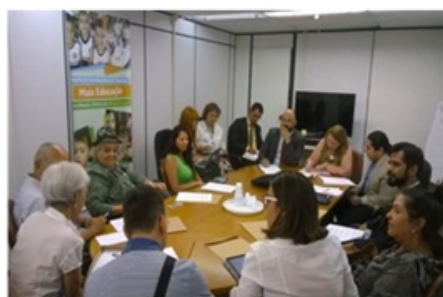
Imagem 2: Primeira reunião no MEC/SEB, em 18/02/2016.