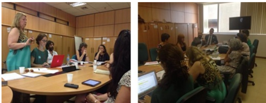
Imagens 3 e 4.