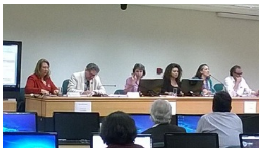
Imagem 9 [8]