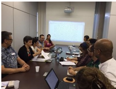
Imagem 5: 07/04/2016 - Reunião MEC-SEB com os especialistas