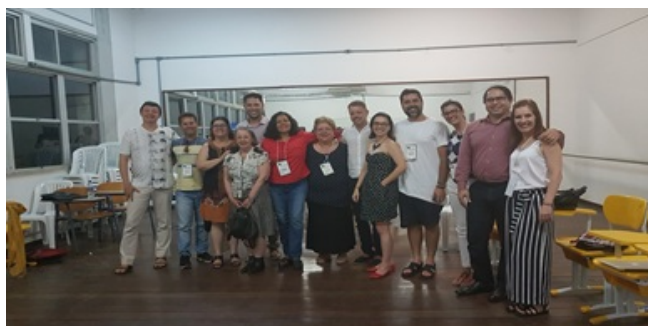
Imagem 7: Grupo de Trabalho das Associações no Simpósio Nacional Arte na Educação Básica.