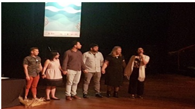
Imagem 8: Encerramento da Mesa das Associações – XXVIII CONFAEB, novembro de 2018 em Brasília.